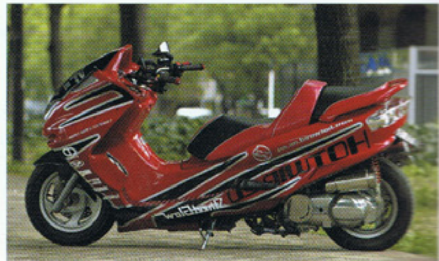
見よ、この美しいバイナルグラフィックを。へたなスポコン系のクルマ真っ青の美しさだ。テールランプはポッシュ製のユーロテールを装着しており、またタンデムバックレストはワイズギア製だ

四輪とバイクのサウンドシステムをメインに手がける名古屋のショップ、ホットワイヤードが製作したこのマジエスティ。レーシーでローダウンされた車体はまさにスポコンの(スポーツコンパクト)のコトよ。知らない人は映画「ワイルドスピード」を見てね)コンセプトをそのまま受け継いで製作されたスペシャルマシンなのだ。 エクステリア系では、まずフロントにキジマ、リアにデイトナ製のローダウンキットを組み込み、YSPフロントマスキを装着。またアールスタッフ製のサイドカウルを付け、流麗かつシヤープなラインを強調しているのだ。 そして、この車体に鮮やかなイタリアンレッドをベースとして、オリジナルのバイナルグラフィックを張り付けている。このバイナルがかなり秀逸なデザインで、マジエスティの持つボディラインを上手く生かした直線的なラインを基調に製作されているのだ。こ